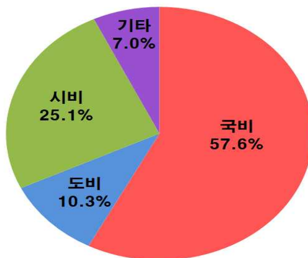
< 사업비 재원별 >