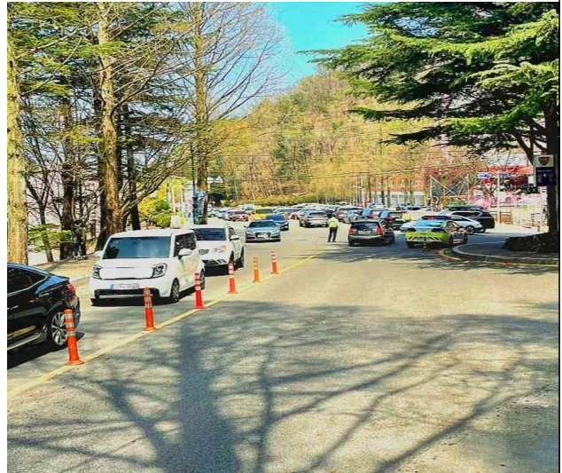
현장 사진 (차량 정체)