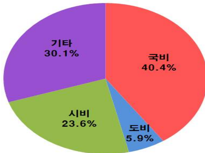
< 사업비 재원별 >