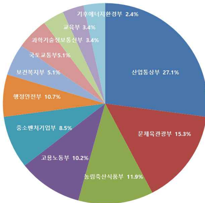
< 공모기관별 선정 건수 >