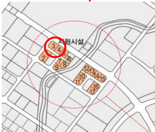
토지내역 (*현재 토지사용가능)