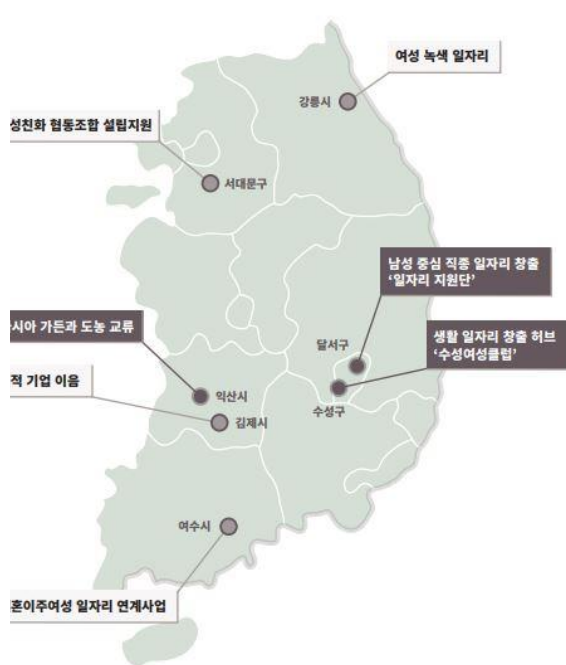
여성일하기 지원 우수사례