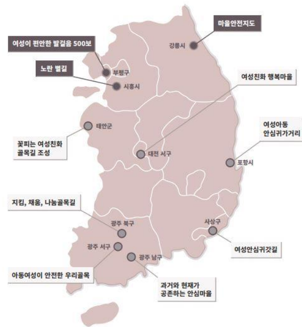
마을에서 시작하는 촘촘한 안전망 우수사례