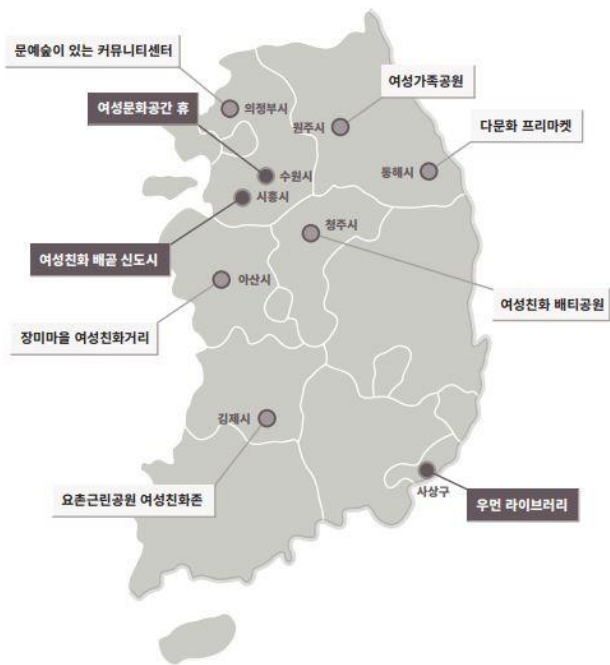
여성에게 열린 공간 우수사례