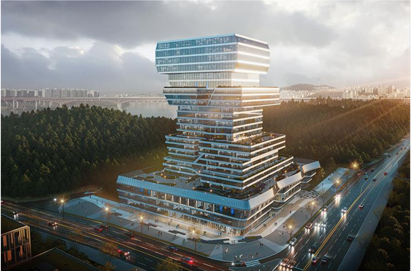
조 감 도