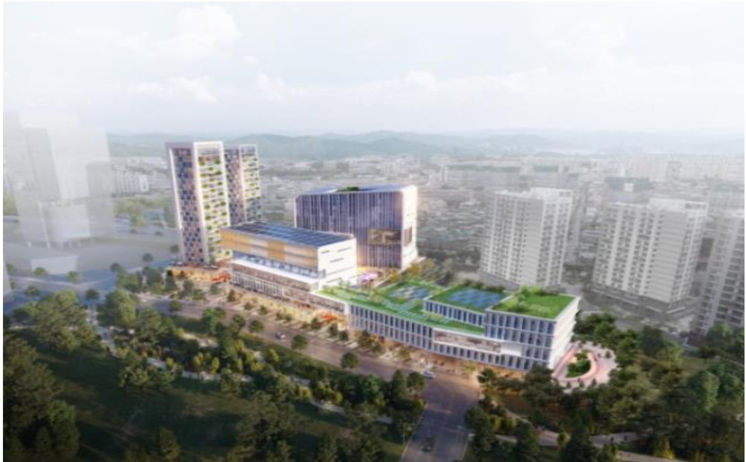
조 감 도